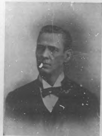
Dr. Alfredo Zayas