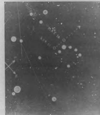
Estrellas telescópicas al E. de delta , Geminorum .